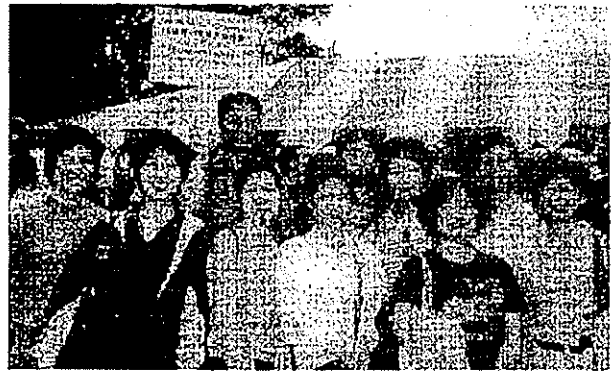
七月二十日 參加「中僑百萬行」