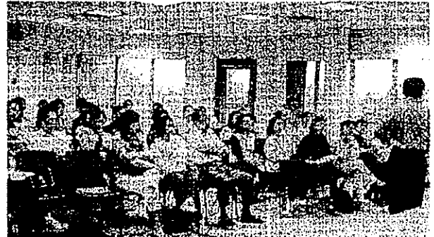
六月六日「如何幫助孩子發揮潛能」講座