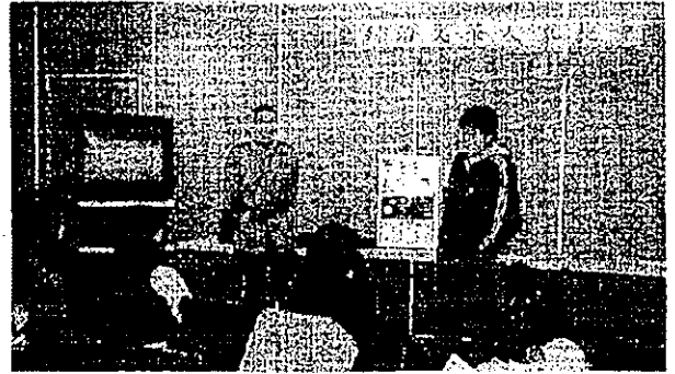
五月十六日「學校安全與毒品問題」講座