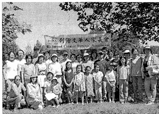
7月24日 Deas Island 家庭郊遊 樂也融融