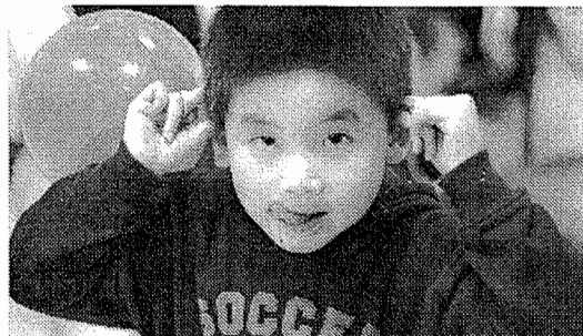
真開心！又好玩，又好吃！