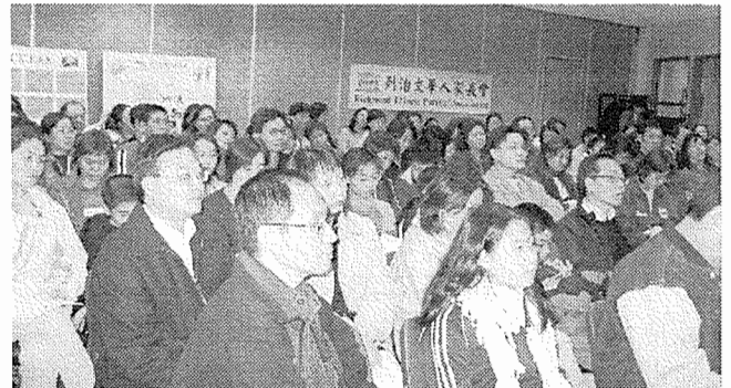
11月12日週年會員大會暨「認識列治文公校的多樣課程」