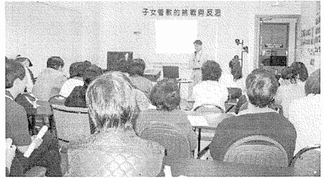
10月14日「子女管教的挑戰與反思」講座